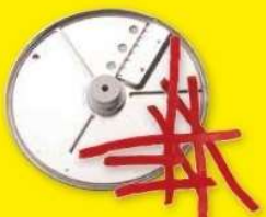
Julienne 4 x 4 mm