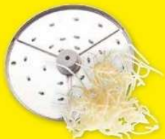
Strouhač 1,5 mm