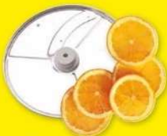
Plátkovač 3 mm